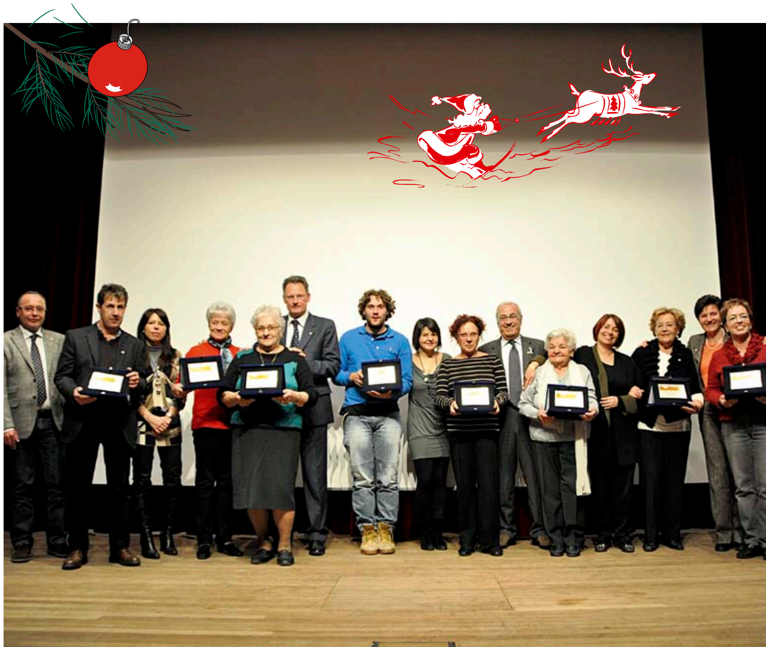
I vincitori del volontariato 2011 (Laives, Bronzolo, Vadena) premiazione Aula Magna di Laives

Bollettino di informazione del Comune di Bronzolo - I.P. Spedizione in a. p. 70% - Filiale Bolzano