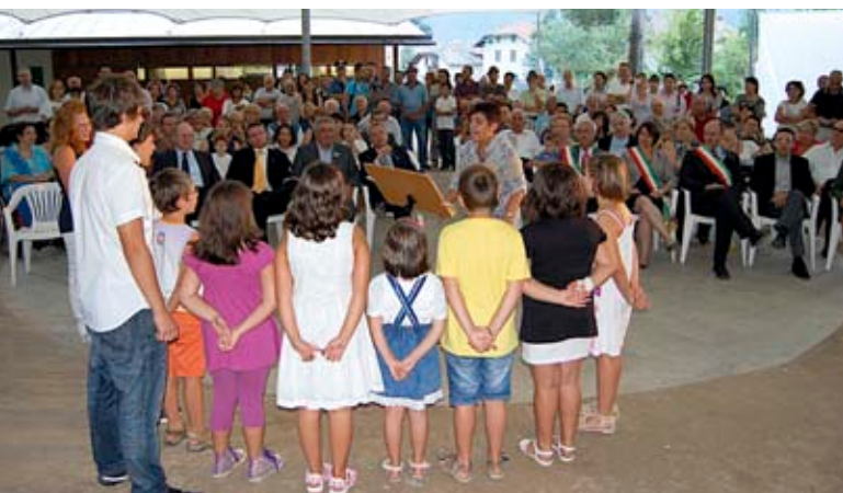
I bambini della "Piccola Filo Bronzolo"