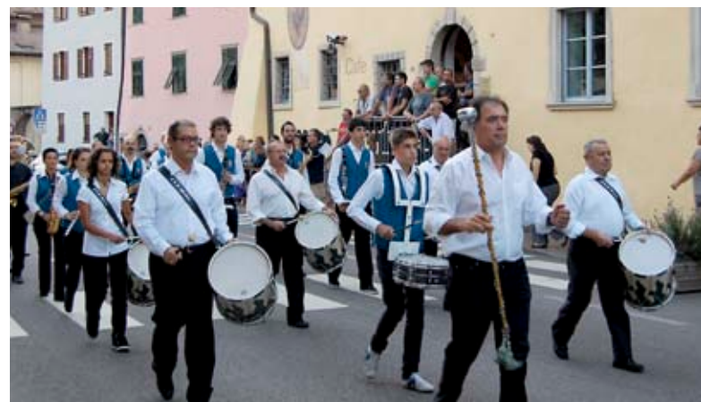
Il corpo musicale Banda Mascagni