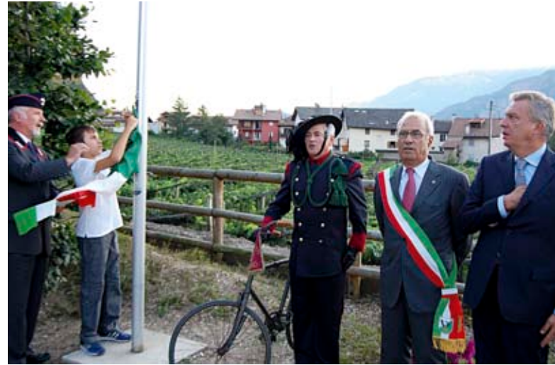
Un momento dell'alzabandiera

La conferenza del Dr. Ragazzoni ha evidenziato non solo